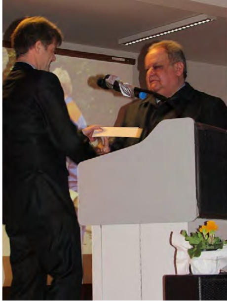
Ein Scheck von Bürgermeister Armin Frink für die Jugendarbeit