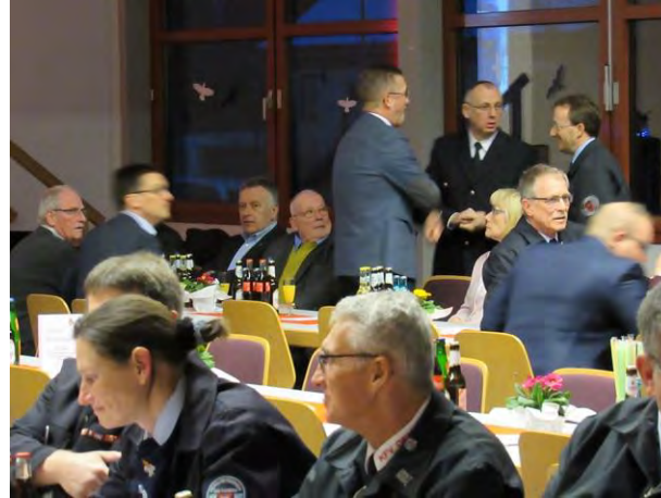
Feierstunde „50 Jahre Verbandsjugendfeuerwehr des Feuerwehrverbandes Wetzlar e.V.“ am 09.02. 2018 in Hohensolms