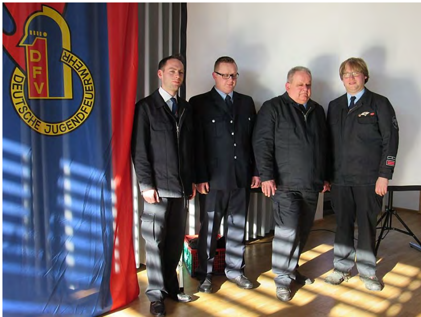
Gruppenbild. Von links:

Verbandsjugendfeuerwehr - Delegiertentag in Hüttenberg-Vollnkirchen am 24.02.2018