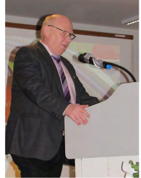
Landrat Wolfgang Schuster