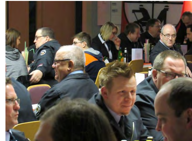
Blick in die Teilnehmerrunde.