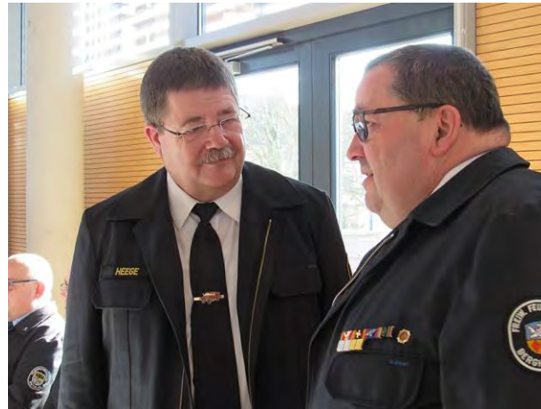
Gespräche am Rande der Delegiertenversammlung.