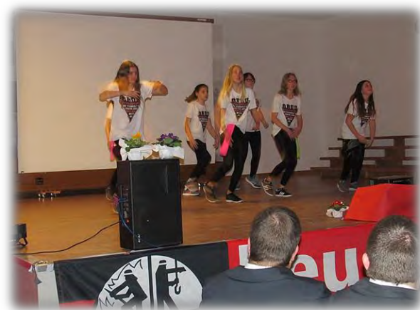
Tanzgruppe „ Get Real Dance Community “